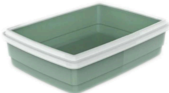
Kattlåda till toalett med strö, t.ex träpellets.