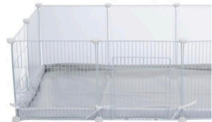
Galler-paneler som enkelt kan byggas till olika hagar.