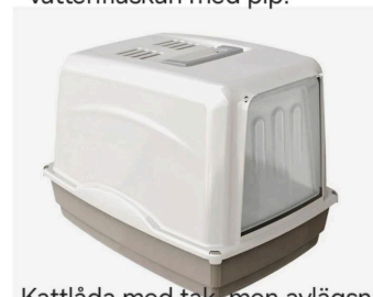
Kattlåda med tak, men avlägsna luckan. Blir ett bra krypin och utsiktsplats, lättstädad.