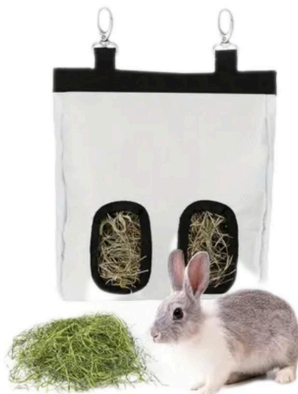
Höhäck som enkelt hängs upp, med mindre hö överallt.