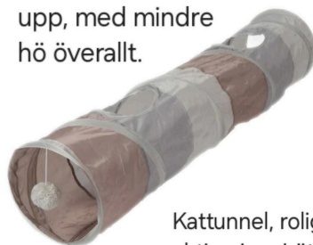
Kattunnel, rolig aktivering. Lätt att tvätta ren.