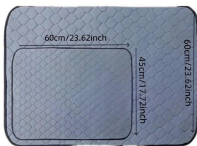
Absorberande underlag som kan tvättas i 60 °.