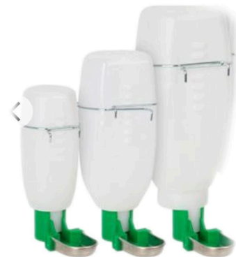
Vattenflaska som har fördelarna från både vattenskålen och vattenflaskan med pip!