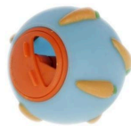
Godisboll till aktivering